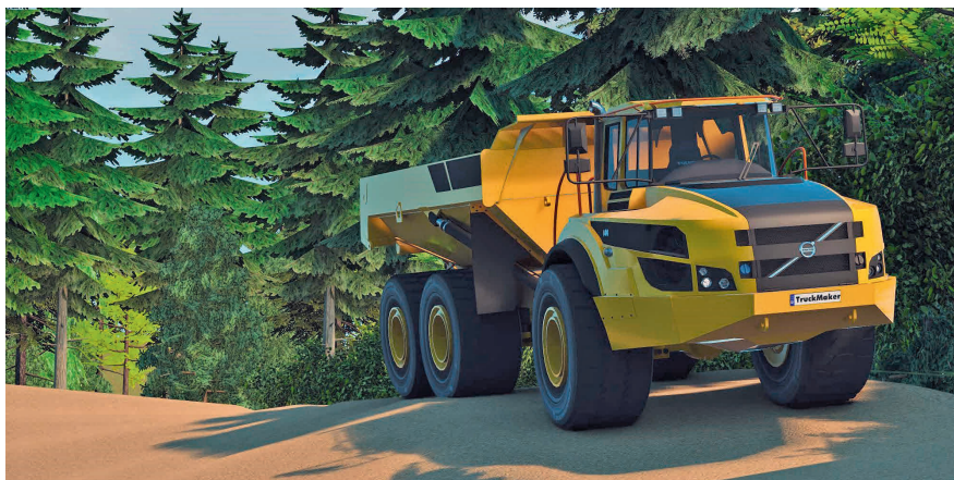
Bild 2: Abbildung eines anspruchsvollen Umweltszenarios in TruckMaker.

kann, ermöglichen HiL-Tests die realitätsnahe Erprobung von Steuergeräten, ohne dass auf reale Prototypen zurückgegriffen werden muss.